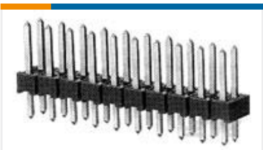
TE 产品编号826942-3 3P MOD2 STIFT LEI