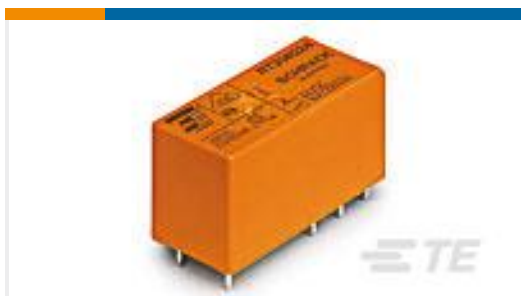
TE 产品编号1393243-1 RTE24005