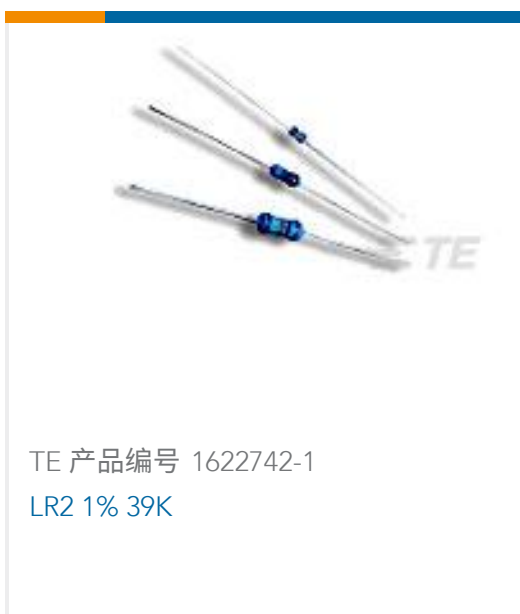
TE 产品编号 1622742-1 LR2 1% 39K