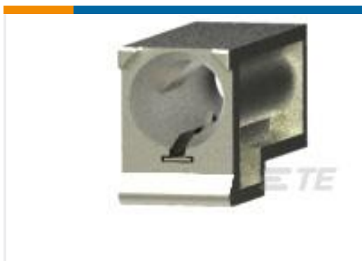
TE 产品编号1-1469492-2 MULTIGIG RT 9MM GUIDE/ESD 45 DEG