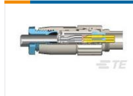
TE 产品编号1-1437719-5 T01-0550-P03-MALE PLUG CONNECTOR SOLDER