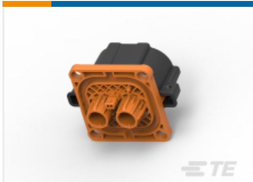
TE 产品编号1-2141227-1 2POS,PIN DIA 8.0,PIN HSG,ASSY,SLD