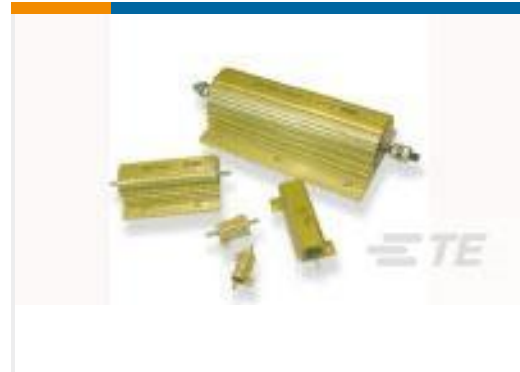
TE 产品编号7-1625971-5 HSA25 R01 5%