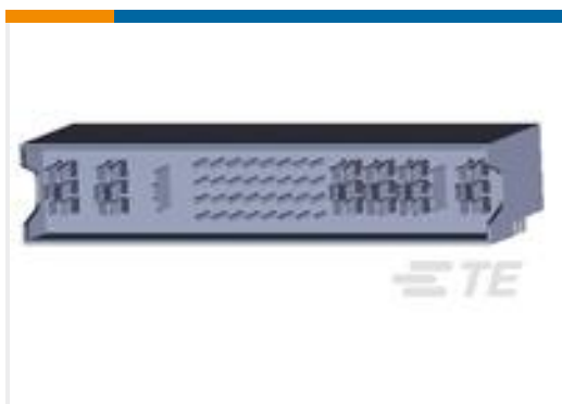
TE 产品编号6450849-7 MBXLE R/A HED 2ACP+1LP+32S+3HDP+1LP+1P