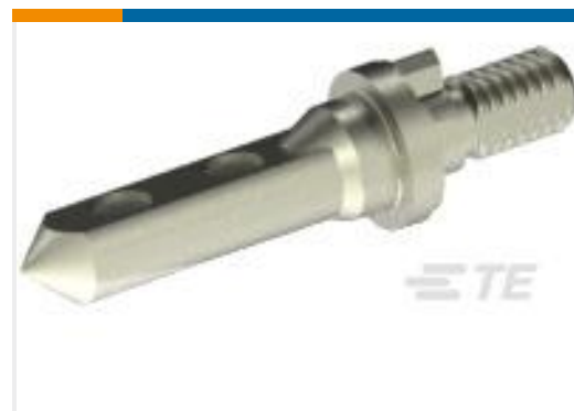
TE 产品编号1-1469491-2 MULTIGIG RT GUIDE PIN, 9MM 2.60