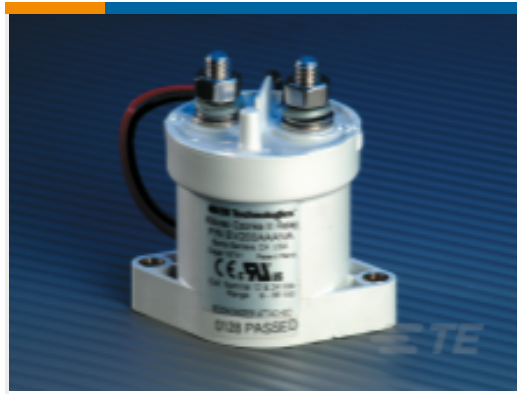
TE 产品编号 1-1618002-6 EV200H2ANA=RELAY, SPST-NO W /AUX