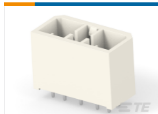
TE 产品编号172035-1 MIC CAP 9P V