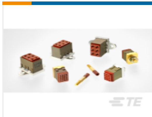
TE 产品编号CTJ722E01C-7067 MODULE ASSY