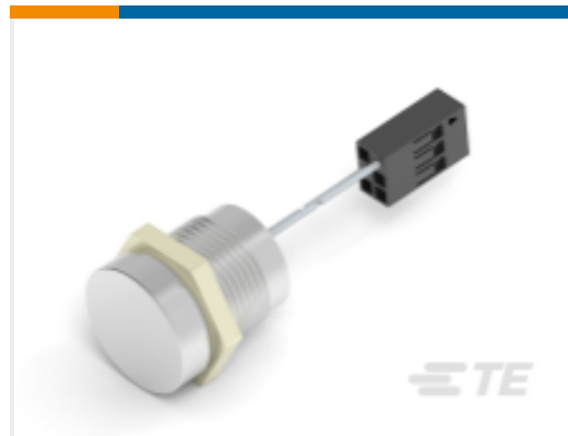
TE 产品编号2342838-1 AVP16M H. FLAT AIO NL 500MM/2X3