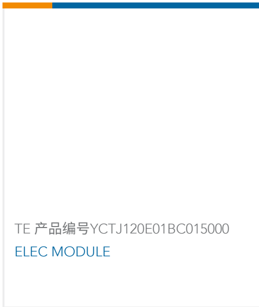
TE 产品编号YCTJ120E01BC015000 ELEC MODULE