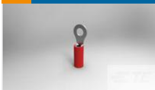
TE 产品编号36152 PIDG R 22-16 COMM 22-18 MIL 6