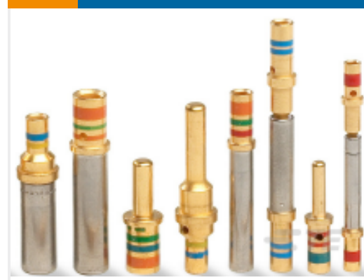
TE 产品编号2560-201-2031L CONT PIN