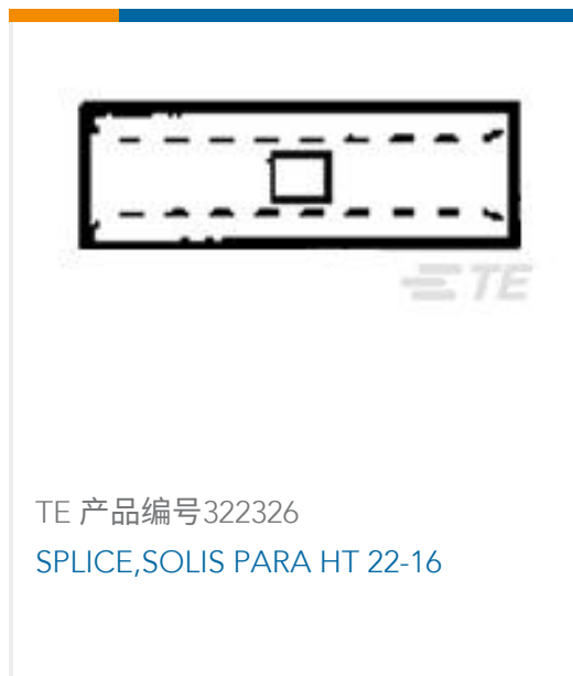
TE 产品编号 322326 SPLICE, SOLIS PARA HT 22-16