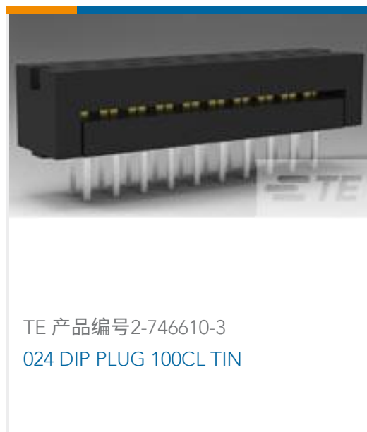
TE 产品编号 2-746610-3 024 DIP PLUG 100CL TIN