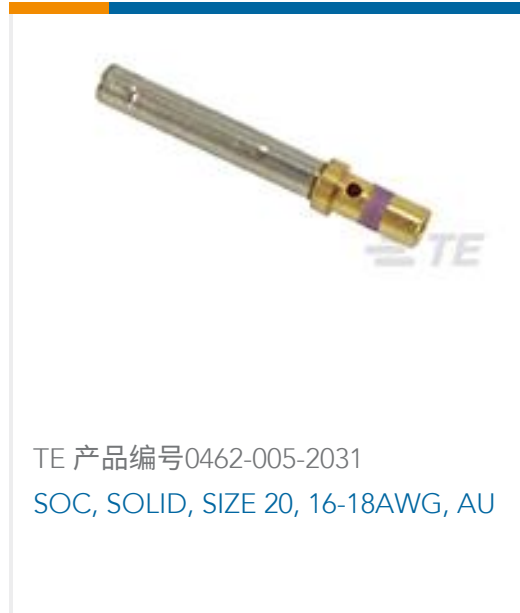
TE 产品编号 0462-005-2031 SOC, SOLID, SIZE 20, 16-18AWG, AU