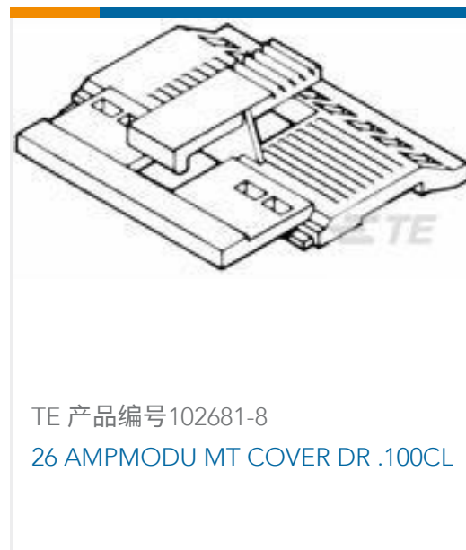
TE 产品编号 102681-8 26 AMPMODU MT COVER DR .100CL