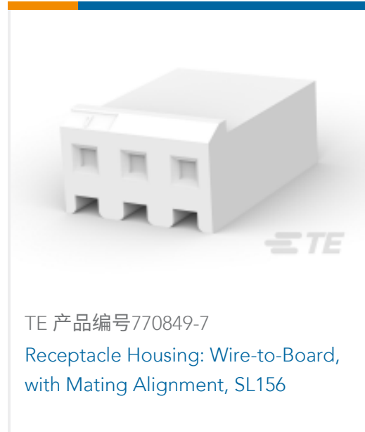
TE 产品编号 770849-7 Receptacle Housing: Wire-to-Board, with Mating Alignment, SL156