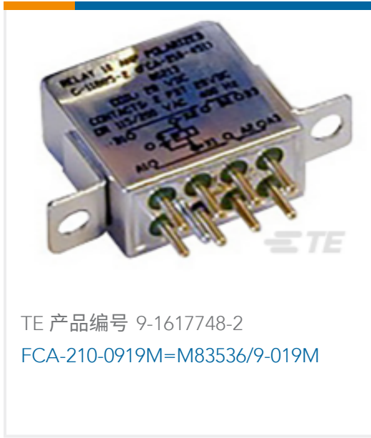
TE 产品编号 9-1617748-2 FCA-210-0919M=M83536/9-019M