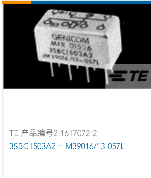
TE 产品编号 2-1617072-2 358C1503A2 = M39016/13-057L