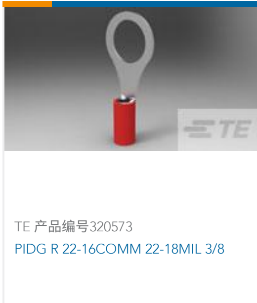
TE 产品编号 320573 PIDG R 22-16COMM 22-18MIL 3/8