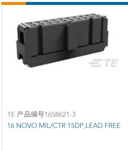
TE 产品编号 1658621-3 16 NOVO MIL/CTR 15DP, LEAD FREE