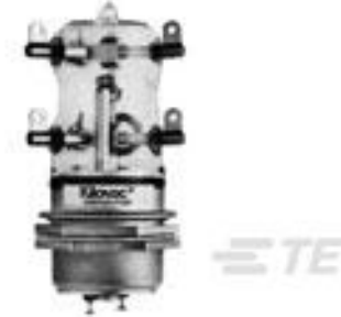
TE 产品编号1-1618273-5 H-16C=RELAY, VACUUM, DPDT