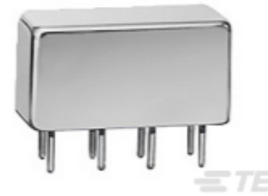
TE 产品编号3-1617536-2 HFW1230F01P=M39016/6-119P