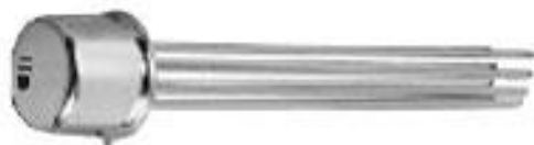
TE 产品编号3-1617118-0 J1MACDD-12XP = M39016/24-028P