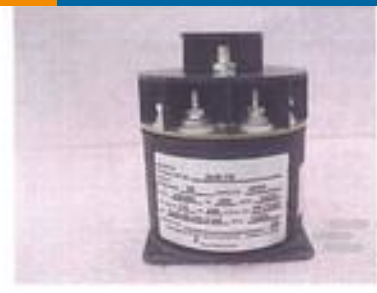
TE 产品编号1-1616037-6 DHR7B=CONTACTOR - 3PDT