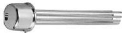
TE 产品编号3-1617118-0 J1MACDD-12XP = M39016/24-028P