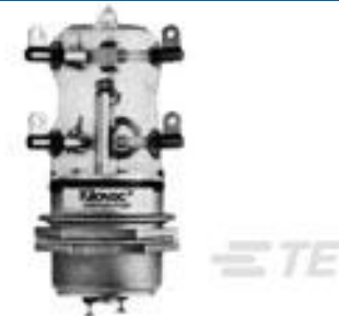
TE 产品编号1-1618273-5 H-16C=RELAY, VACUUM, DPDT