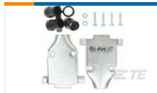
TE 产品编号5748676-2 DIE CAST CBL CLMP KIT,SZ 2