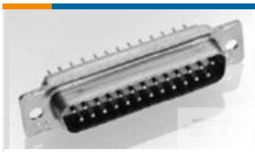
TE 产品编号1757820-8 AMPLIMITE,ASY,RCPT,STD,109,ZN,3,CT