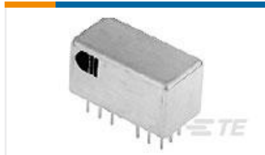
TE 产品编号6-1617090-0 LS-9523M = DPDT LATCHING RELAY