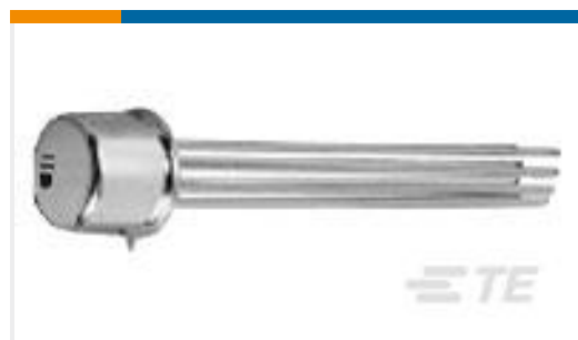
TE 产品编号1617167-6 JMSCDD-26XP = M39016/21-038P