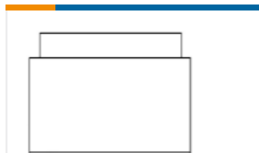
TE 产品编号TJ11E-06-01 MODULE ASSY