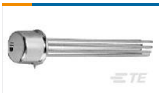
TE 产品编号6-1617540-1 J1MACT-18XP=M28776/5-029P