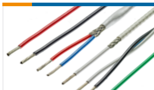
TE 产品编号858071-000 44AM1144-22-3/5/6/9-9