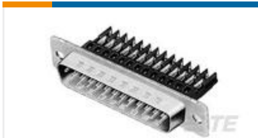
TE 产品编号2-745492-0 PLUG ASSY,9P,HDE,MS