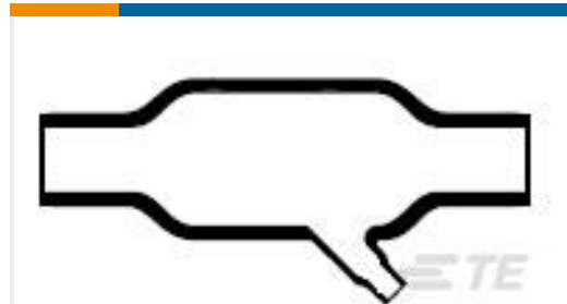
TE 产品编号822066-000 342A012-3/42-0