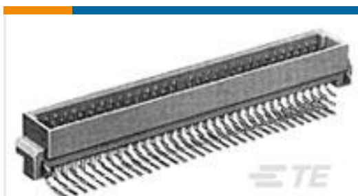
TE 产品编号5148116-5 ASSY,PIN,EUROCARD,TYPE C,LEAD-FREE,96 PO