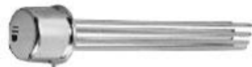
TE 产品编号3-1617118-0 J1MACDD-12XP = M39016/24-028P