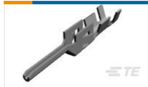
TE 产品编号1-794612-2 PIN CONT 20-24 30 GOLD L/P