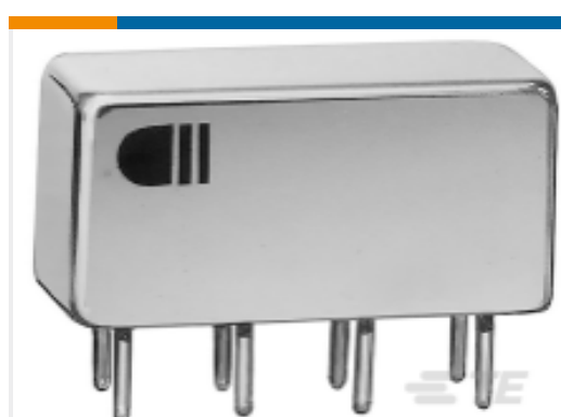
TE 产品编号 CAT-3SBC-DPDT-WCS DPDT Signal Relay: Electrically-Held, With Coil Suppression