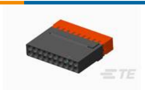
TE 产品编号253627-000 MTCP-122-20S2