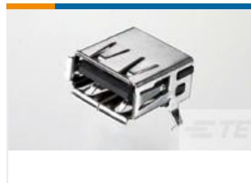
TE 产品编号1-292303-1 Std USB Type A, R/A, SMT