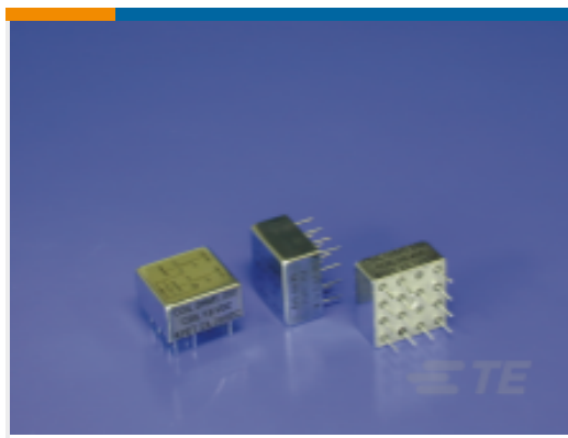
TE 产品编号 2-1617076-6 3SBH1231A2 = M39016/53-012M