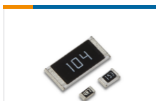
TE 产品编号2176337-7 CRGCQ 0402 33R 1%