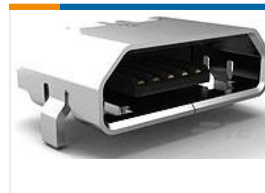
TE 产品编号2134536-2 MICRO USB, TYPE A/B, GRAY