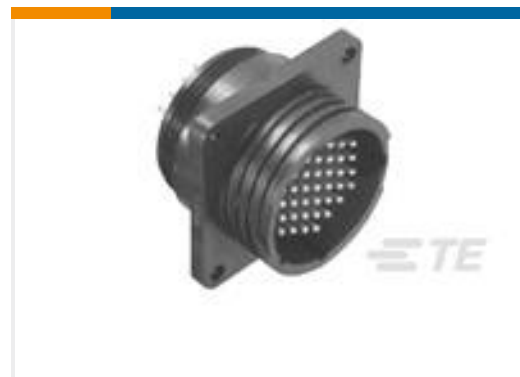
TE 产品编号208223-9 CPC RECPT ASSEMBLY SIZE 13-9