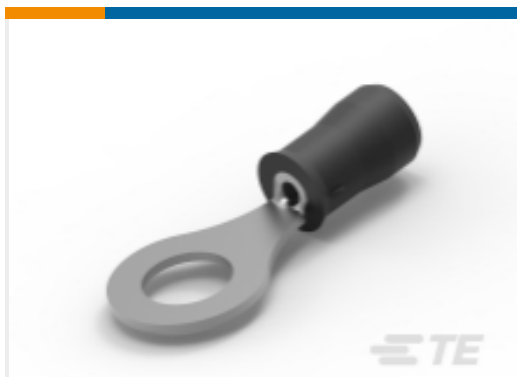
TE 产品编号52273 PIDG Ring Tongue Terminals