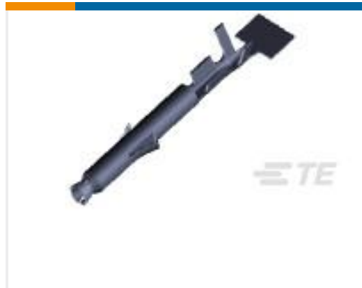
TE 产品编号170361-1 UNIV M-N-L SOC. 26-22 AWG