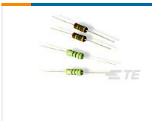
TE 产品编号1623719-6 CCR1 1K0 10%