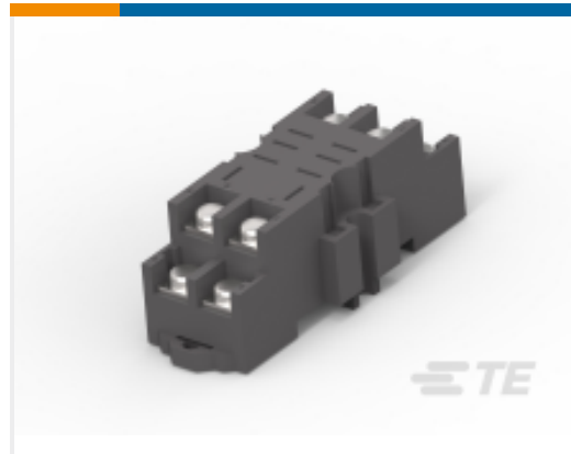
TE 产品编号2-1419106-7 27E895=SOCKET,K10,8,OC,POLY,NA