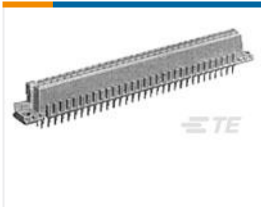
TE 产品编号5650858-5 ASSEMBLY,RECEPTACLE,EUROCARD, T