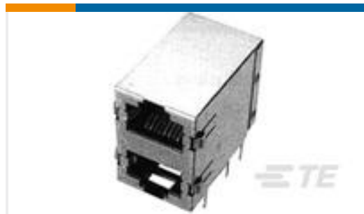
TE 产品编号5569381-1 STK MJ ASSY,8POS,2X1,SHLD,CAT5