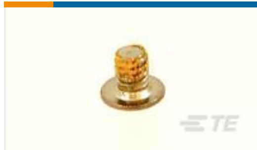
TE 产品编号1410946-1 MULTI-GIG SOC. CAP SCREW, CUSTOMIZED HDW