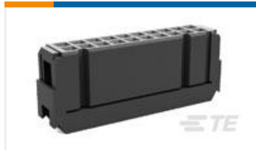
TE 产品编号1658620-6 26 NOVO MIL 15DP, LEAD FREE