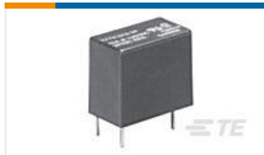
TE 产品编号1393194-9 T77S1D10-12