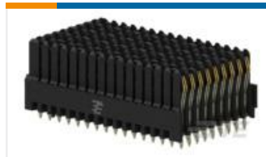
TE 产品编号1410141-1 MULTIGIG RT T2 .8" BP FULL LEF