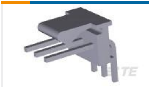
TE 产品编号640457-3 03P MTA100 HDR ASSY SQ R/A F/L