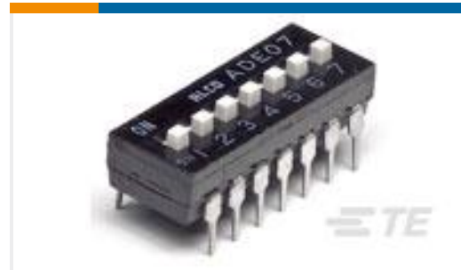
TE 产品编号1825057-1 ADE0204=DIP SWITCH,EXT,THRU/HL