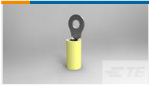
TE 产品编号2-320568-3 TERMINAL,PIDG R IR 10 8