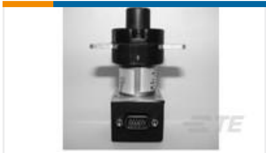
TE 产品编号8-1616982-7 K4001B5C2=CONTACTOR 400 A SPST 28 VDC