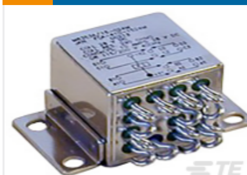
TE 产品编号6-1617814-2 TD229-1002P=TDFR 10 S M83726/29-1002P