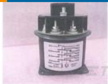
TE 产品编号 1616037-7 DH7BB=RELAY