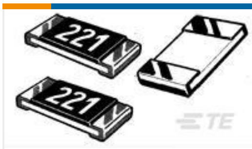
TE 产品编号2176070-3 3521 12R 1% 2W