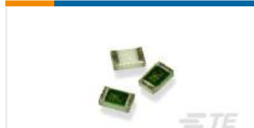
TE 产品编号5-1614894-6 CPF 0805 681K 0.1% 25PPM 1K RL