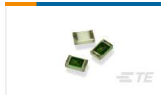
TE 产品编号8-1614884-8 CPF 0805 16K 0.1% 25PPM 1K RL