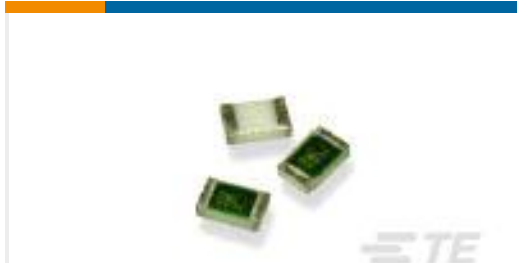
TE 产品编号1-1614885-6 CPF 0805 330K 0.1% 25PPM 1K RL