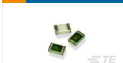
TE 产品编号1-1614959-2 CPF0805 1M6 0.1% 25PPM 1K RL