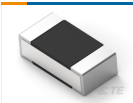
TE 产品编号7-2176305-3 RP 1E 0.1W 604R 0.1% 25PPM 5K RL