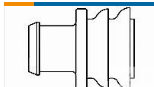
TE 产品编号281934-2 SINGLE WIRE SEAL