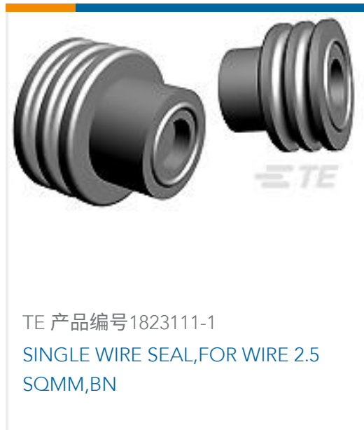
TE 产品编号1823111-1 SINGLE WIRE SEAL, FOR WIRE 2.5 SQMM, BN