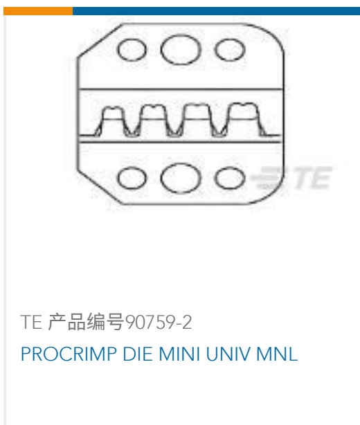
TE 产品编号90759-2 PROCRIMP DIE MINI UNIV MNL