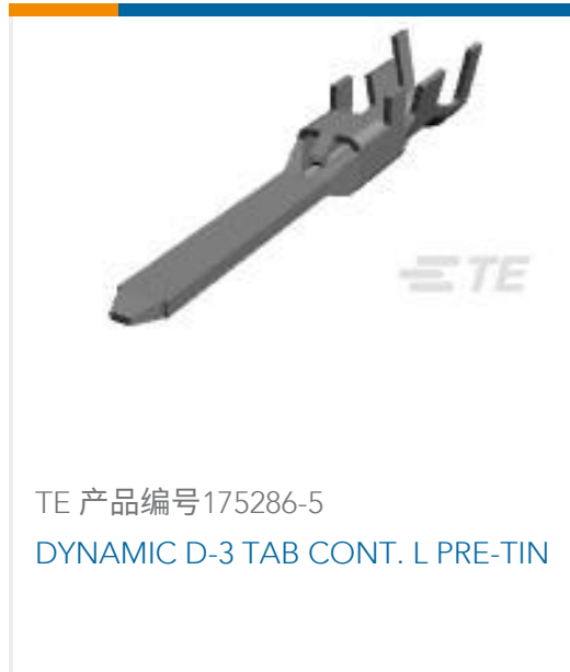
TE 产品编号175286-5 DYNAMIC D-3 TAB CONT. L PRE-TIN