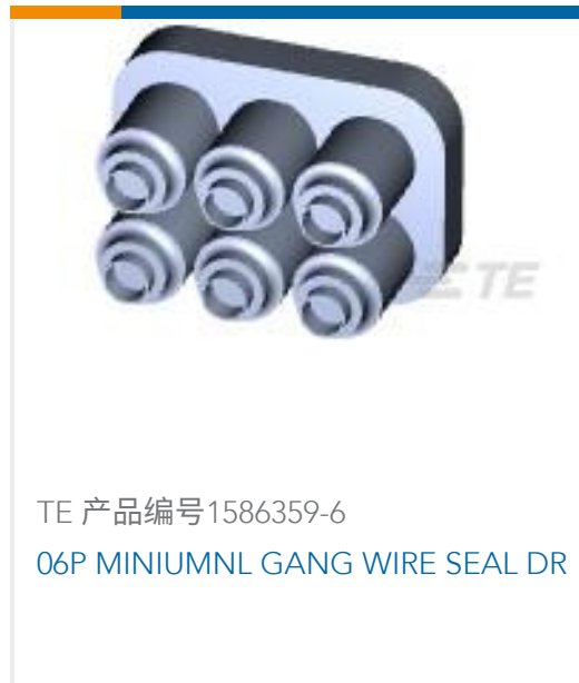
TE 产品编号1586359-6 06P MINIMUMNL GANG WIRE SEAL DR