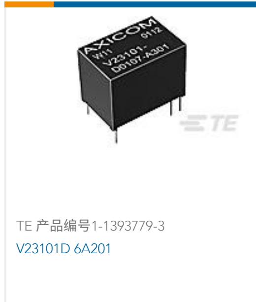
TE 产品编号1-1393779-3 V23101D 6A201