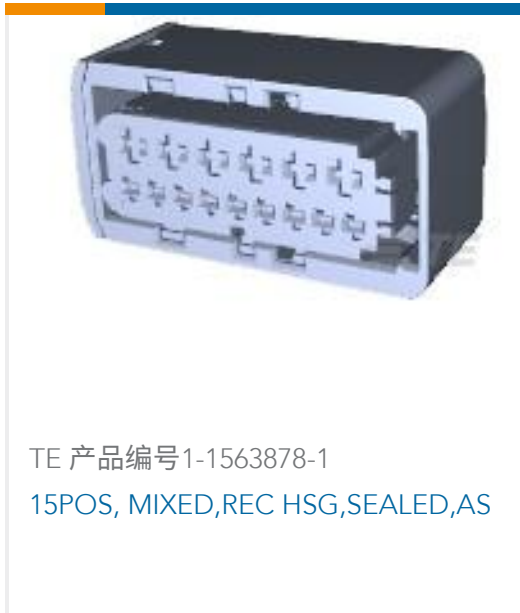
TE 产品编号1-1563878-1 15POS, MIXED, REC HSG, SEALED, AS