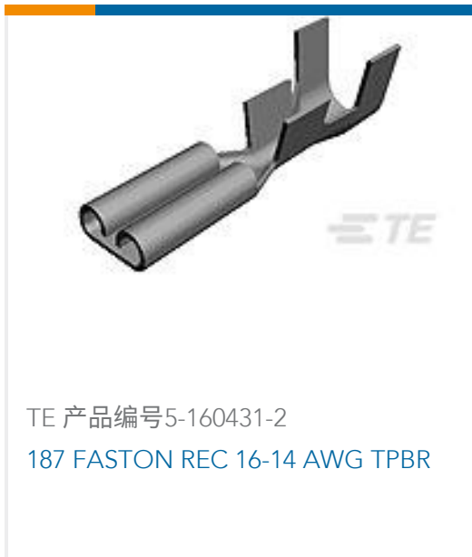
TE 产品编号5-160431-2 187 FASTON REC 16-14 AWG TPBR