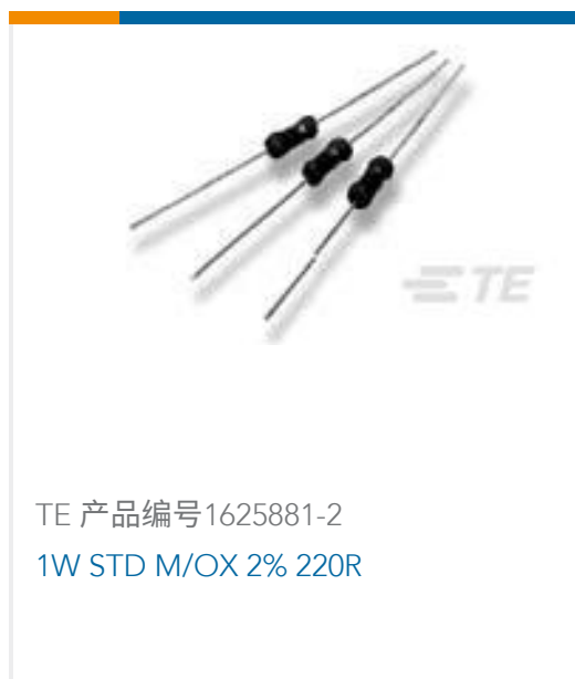
TE 产品编号1625881-2 1W STD M/OX 2% 220R