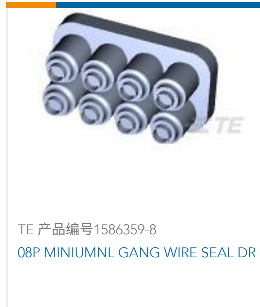
TE 产品编号1586359-8 08P MINIMUMNL GANG WIRE SEAL DR