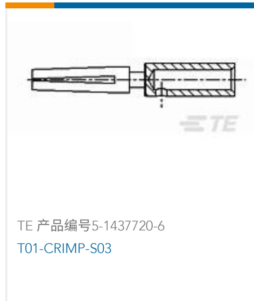
TE 产品编号5-1437720-6 T01-CRIMP-S03