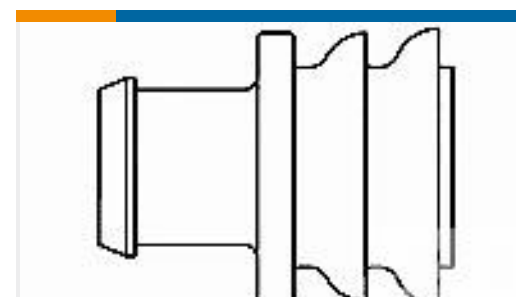
TE 产品编号281934-2 SINGLE WIRE SEAL