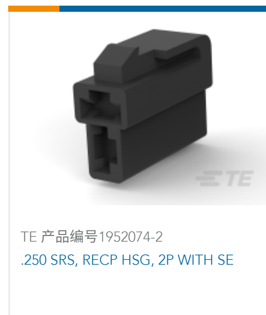
TE 产品编号1952074-2 .250 SRS, RECP HSG, 2P WITH SE