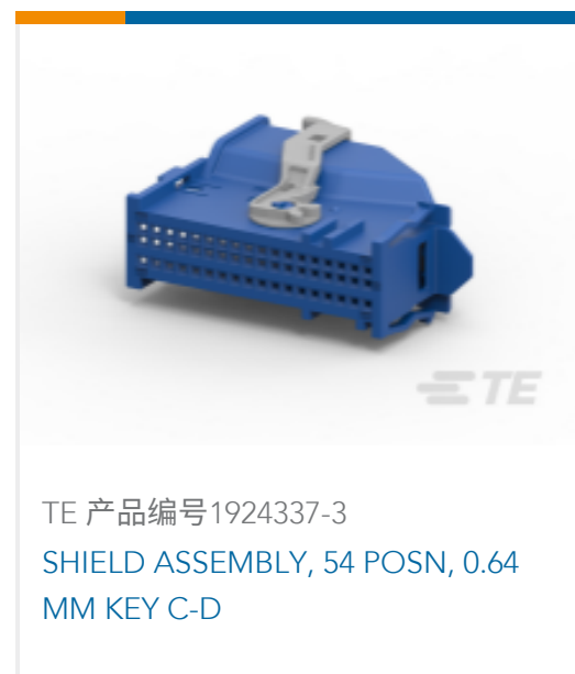
TE 产品编号1924337-3 SHIELD ASSEMBLY, 54 POSN, 0.64 MM KEY C-D