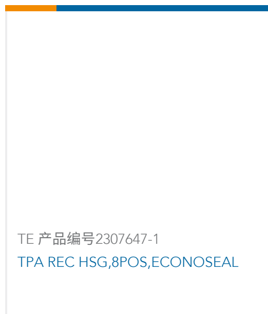
TE 产品编号2307647-1 TPA REC HSG,8POS,ECONOSEAL