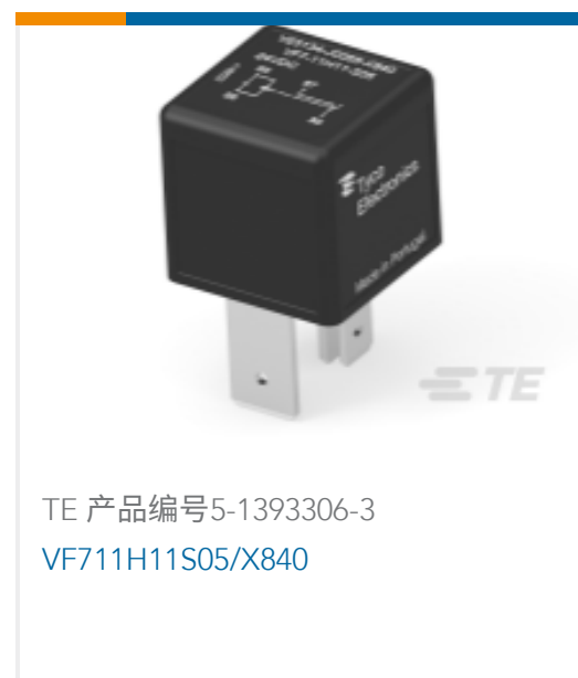
TE 产品编号5-1393306-3 VF711H11S05/X840