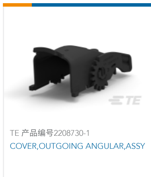
TE 产品编号2208730-1 COVER,OUTGOING ANGULAR,ASSY