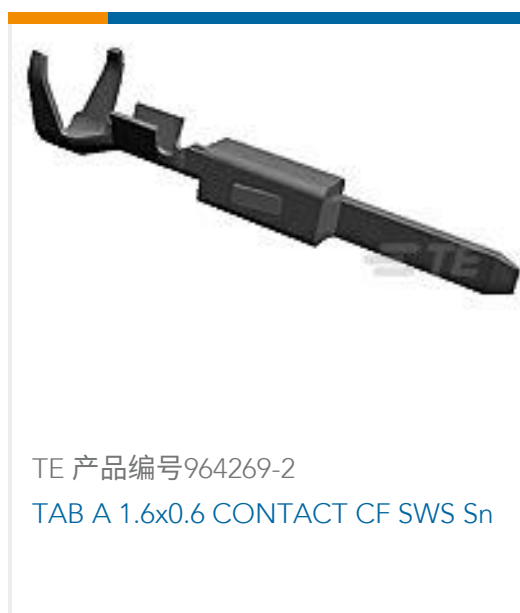
TE 产品编号964269-2 TAB A 1.6x0.6 CONTACT CF SWS Sn