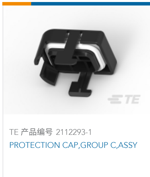
TE 产品编号 2112293-1 PROTECTION CAP,GROUP C,ASSY