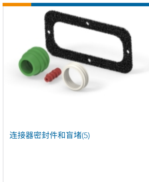
连接器密封件和盲堵(5)