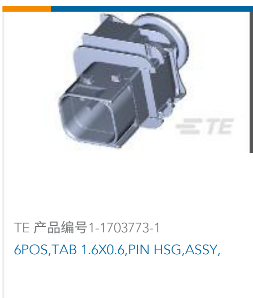
TE 产品编号1-1703773-1 6POS,TAB 1.6X0.6,PIN HSG,ASSY,