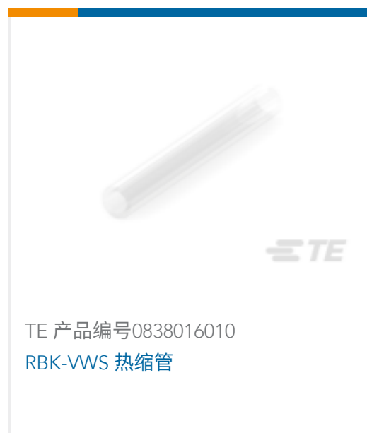
TE 产品编号0838016010 RBK-VWS 热缩管