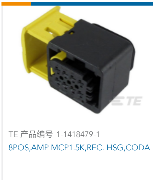
TE 产品编号 1-1418479-1 8POS,AMP MCP1.5K,REC. HSG,CODA