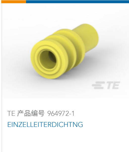
TE 产品编号 964972-1 EINZELLEITERDICHTNG