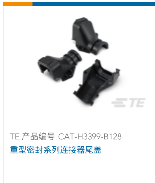
TE 产品编号 CAT-H3399-B128 重型密封系列连接器尾盖