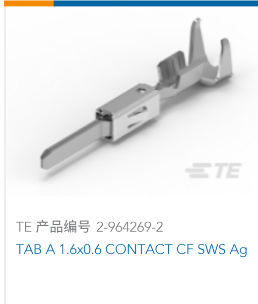
TE 产品编号 2-964269-2 TAB A 1.6x0.6 CONTACT CF SWS Ag