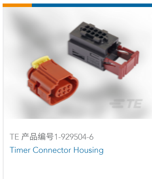
TE 产品编号1-929504-6 Timer Connector Housing