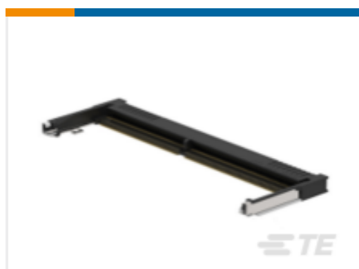
TE 产品编号2309411-1 DDR4 SO DIMM Sockets