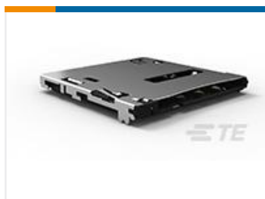
TE 产品编号2174803-2 PUSH-PUSH MICRO SIM CONNECTOR