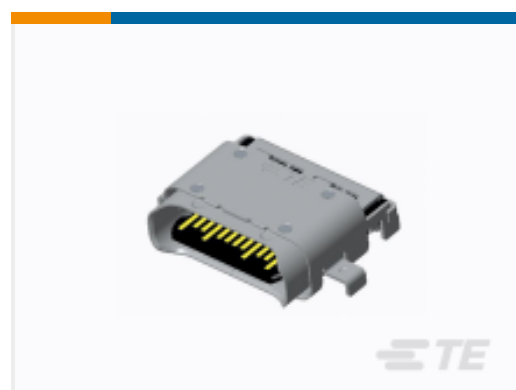
TE 产品编号1-2295018-2 USB TYPE C, REC OFFSET 0.65MM DUAL SMT