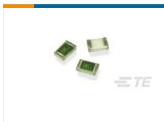
TE 产品编号4-2176091-1 RP 2A 0.25W 150R 0.1% 25PPM 1K RL