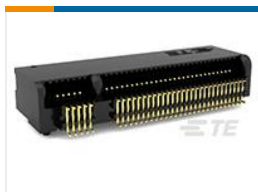
TE 产品编号2199230-4 M.2 0.5PITCH 4.2H KEY E 15U" AU