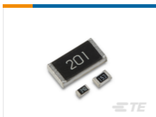
TE 产品编号4-2176325-9 CRGP 0402 100K 1%