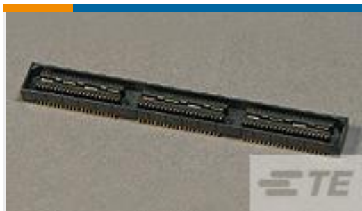
TE 产品编号2-1658012-3 MSB0.80RC-ASY120FL,-,10,-TY