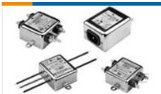
TE 产品编号1-6609027-5 10EK7=F7095 S0