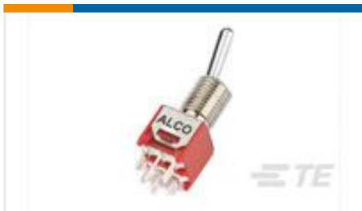
TE 产品编号2267077-1 TMS1T4B5M2RE