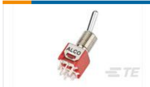
TE 产品编号2267077-1 TMS1T4B5M2RE