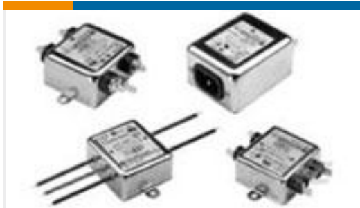
TE 产品编号1-6609027-5 10EK7=F7095 S0