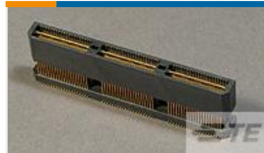
TE 产品编号1658017-3 MSB0.80PL19ASY120FL,-,10,-TY