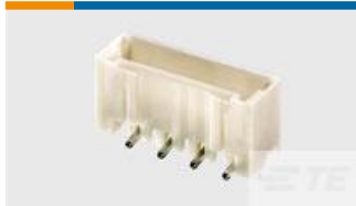
TE 产品编号292231-3 1.5 MINI CT SGL V SMT W/O BOSS