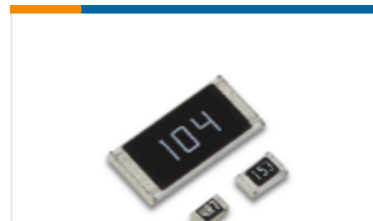
TE 产品编号2176347-6 CRGCQ 2010 27R 1%