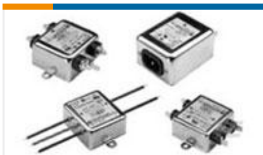
TE 产品编号1-6609027-5 10EK7=F7095 S0