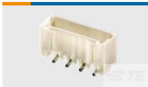
TE 产品编号292231-3 1.5 MINI CT SGL V SMT W/O BOSS