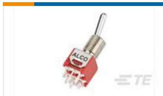
TE 产品编号2267077-1 TMS1T4B5M2RE