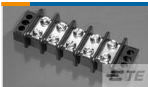
TE 产品编号 1-1546310-4 14P.563" DR BARRIER STRIP