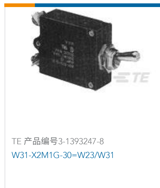
TE 产品编号3-1393247-8 W31-X2M1G-30=W23/W31