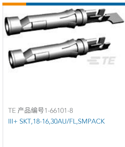
TE 产品编号1-66101-8 III+ SKT,18-16,30AU/FL,SMPACK