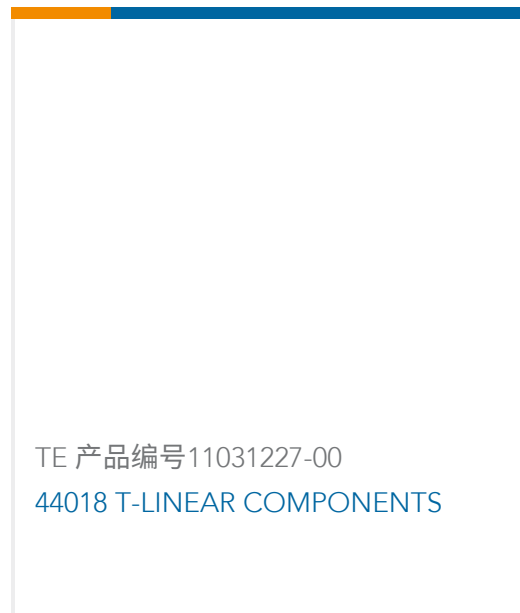
TE 产品编号11031227-00 44018 T-LINEAR COMPONENTS