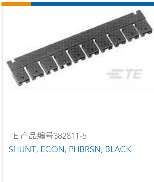
TE 产品编号382811-5 SHUNT, ECON, PHBRN, BLACK