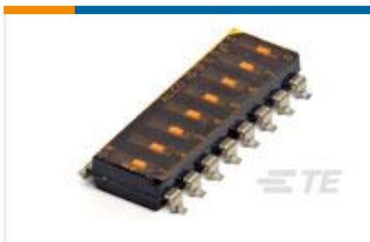
TE 产品编号1-1825006-9 GDS10S04=DIP SW,SLIDE,SMT