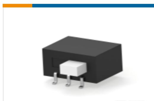
TE 产品编号1-1437581-1 ASE22RL=AUTOSLIDE DP