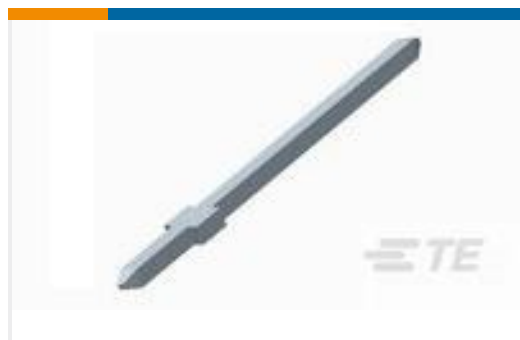
TE 产品编号1-928836-2 MOD2 PIN WITH A-PIN L/P