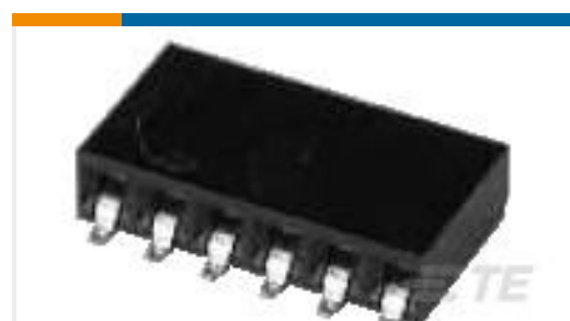
TE 产品编号 2-5147733-5 26 MODII HORZ SR SFMNT SN