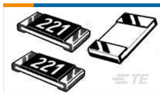
TE 产品编号5-2176070-9 3521 2K7 1% 2W