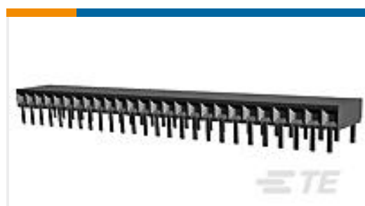
TE 产品编号 2-5535677-7 26 MODII HORZ SR CE 100CL