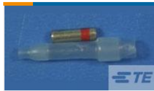
TE 产品编号664681-000 D-609-07CS2603