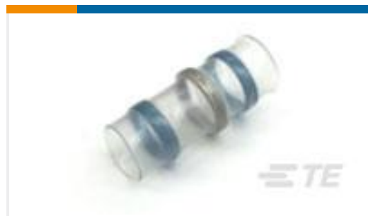
TE 产品编号257509N002 S02-10-R-6CS816