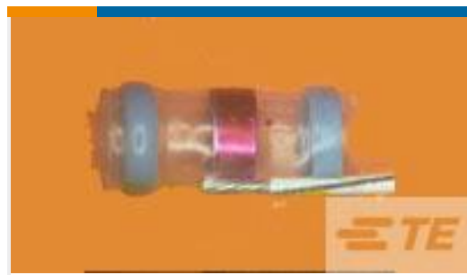
TE 产品编号942147N002 S02-10-R-5CS816