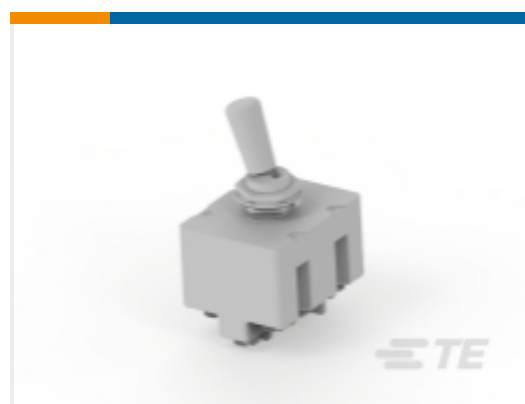
TE 产品编号K1002956 Toggle Switch 08-4-1-13