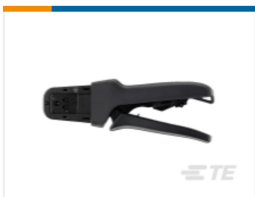
TE 产品编号DTT-20-03 CRIMP TOOL