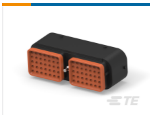
TE 产品编号DRC16-70SBE-P013UK PLG, 70P, BLK, E, SEAL BOND, B