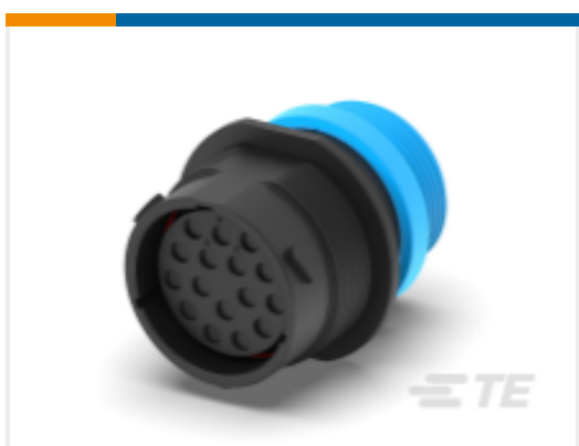
TE 产品编号HDP24-24-16SE-L015 REC, 16P, BLK, E, THD, 12, S