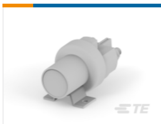
TE 产品编号K1008699 Relay 26-60-05