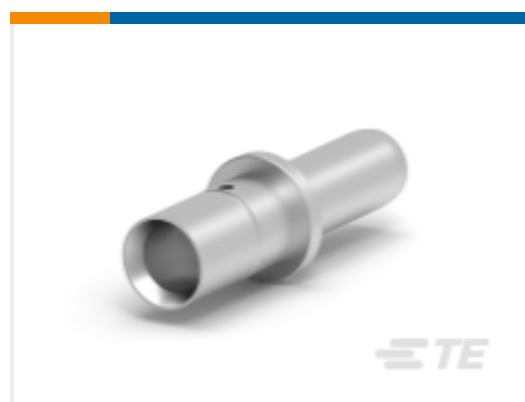
TE 产品编号SRK-PC-080-25-601 PIN, SOLID, SIZE M8, 25mm2, AG