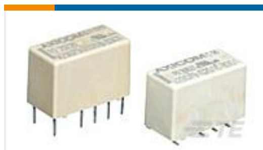
TE 产品编号1-1393788-1 V23079A1003B301