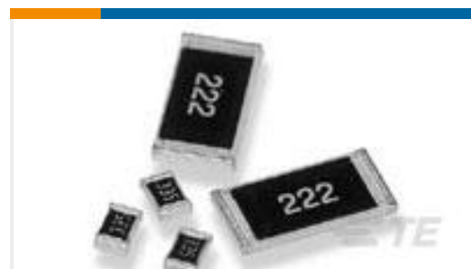
TE 产品编号1623246-1 CRG0805 1% 51R