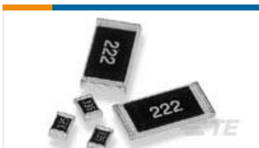
TE 产品编号1623404-1 CRG1206 1% 10K