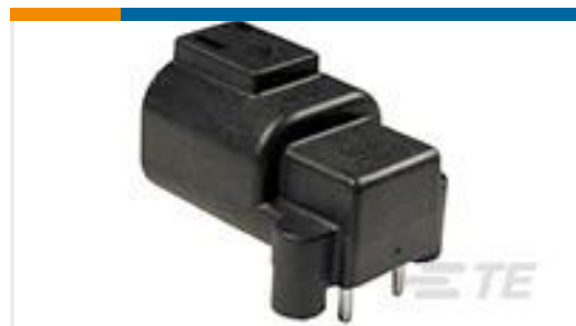
TE 产品编号DTF13-4P HDR, 4P, BLK, RA, SN/NI/CU