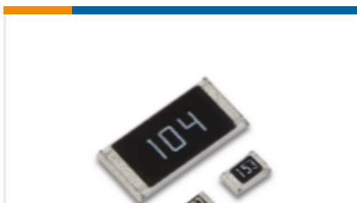
TE 产品编号4-2176343-3 CRGCO 1206 33K 1%