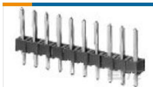
TE 产品编号5-146282-4 04 MODII HDR SRST B/A .100CL