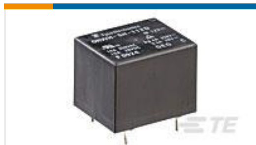
TE 产品编号1-1721150-3 ORWH-SH-112D1F,000