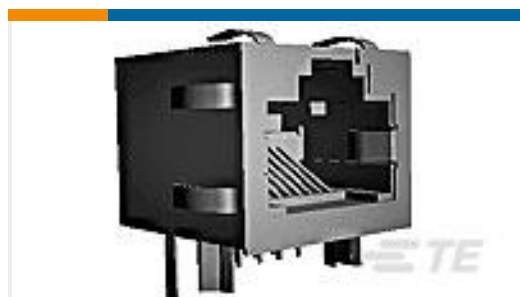
TE 产品编号1-406541-8 MJ,INV,1X1,0PNL G,.100"ST,SN