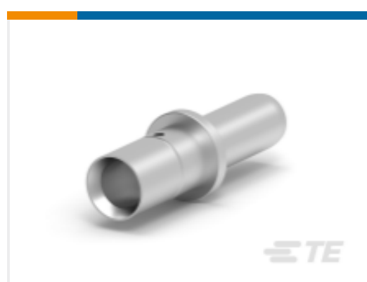
TE 产品编号SRK-PC-080-25-601 PIN, SOLID, SIZE M8, 25mm2, AG