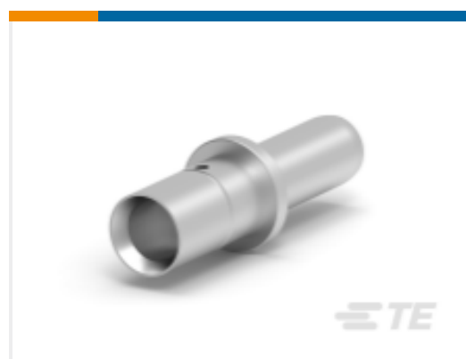
TE 产品编号SRK-PC-080-25-601 PIN, SOLID, SIZE M8, 25mm2, AG