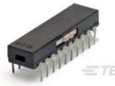
TE 产品编号6-1825011-4 ASF62RG04=6PDT AUTOSLIDE