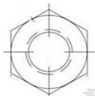
TE 产品编号1-328690-2 JAM NUT, GOLD PLATED