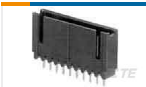
TE 产品编号5-103414-4 06 MODII HDR SRST SHRD LF