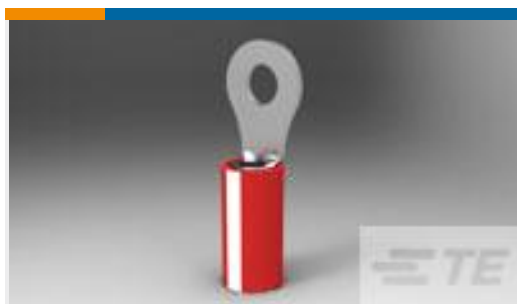
TE 产品编号51863-4 TERMINAL,PIDG R IR 18 6