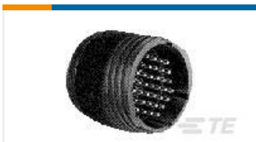
TE 产品编号206705-2 CPC 13-9 FREE HANGING RECPT