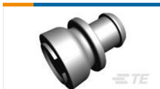
TE 产品编号828922-1 2,5MM CAVITY PLUG FOR 5,4MM DI