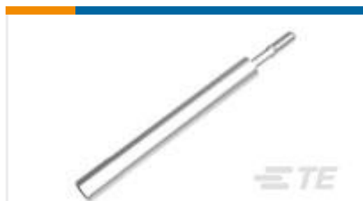
TE 产品编号747784-8 JACKSCREW KIT,4-40, BULK