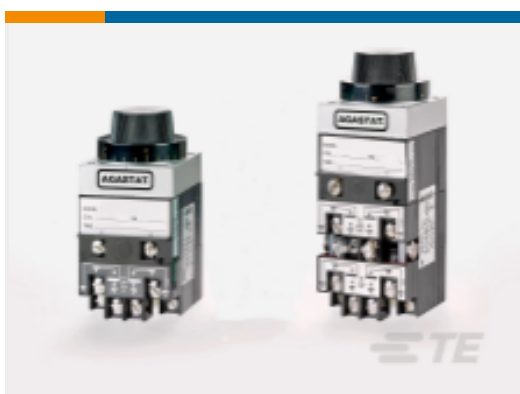
TE 产品编号 3-1423159-3 7012PJ=RLY,STD,ON,2P,125VDC,1