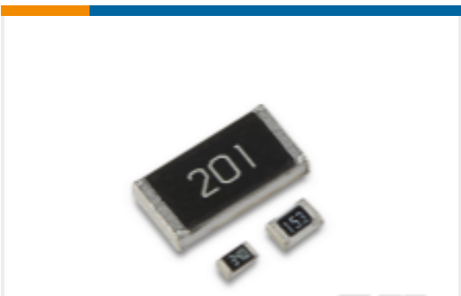
TE 产品编号2176330-1 CRGP 2010 10R 1%