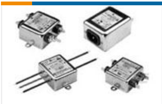
TE 产品编号1-6609028-7 20VK1=F7147 S0