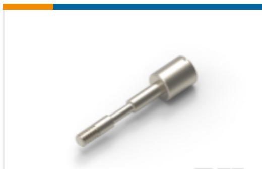
TE 产品编号2-1393561-9 V42254A 262V 19=SUB D SCHRAUBE