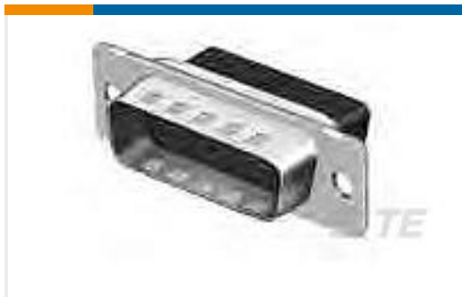
TE 产品编号205206-8 HDP-20,PLUG,SIZE 2, 15 POSN