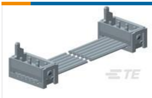
TE 产品编号1483351-2 MICRO-MATCH LEAD 06P 150MM