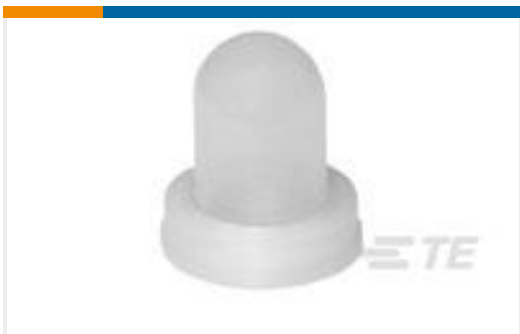
TE 产品编号1-1423696-6 BOOTSEAL,M11,CLEAR,SILICONE