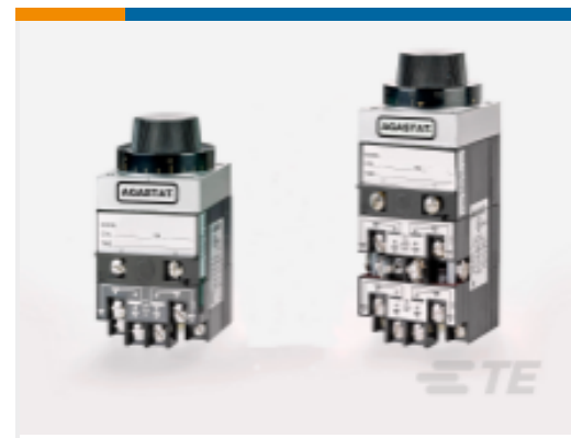
TE 产品编号 1-1423171-9 E7022SBT004=RLY,NUC,OFF,2P,250