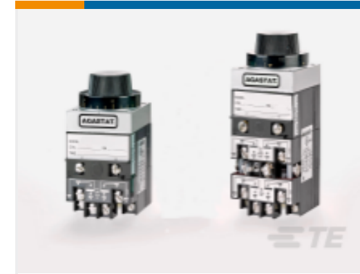
TE 产品编号 1423170-8 E7022AHT004=E7022AHT004