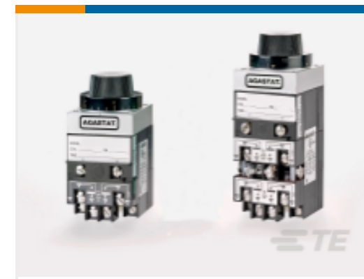
TE 产品编号 1-1437483-7 E7012ADLL004=RLY,NUC,ON,2P,12