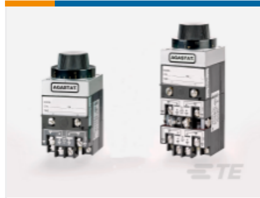
TE 产品编号 1-1437484-2 E7022AFST004=RLY,NUC,OFF,2P,1