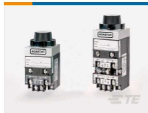
TE 产品编号 2-1437462-3 E7022PK004=RLY,NUC,OFF,2P,125