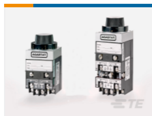
TE 产品编号 4-1437483-3 E7012PAL004=RLY,NUC,ON,2P,125