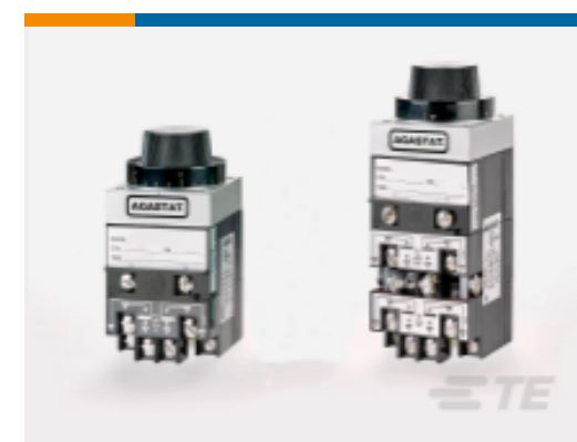
TE 产品编号 3-1423169-6 E7012SB004=RLY,NUC,ON,2P,250VDC,5SEC