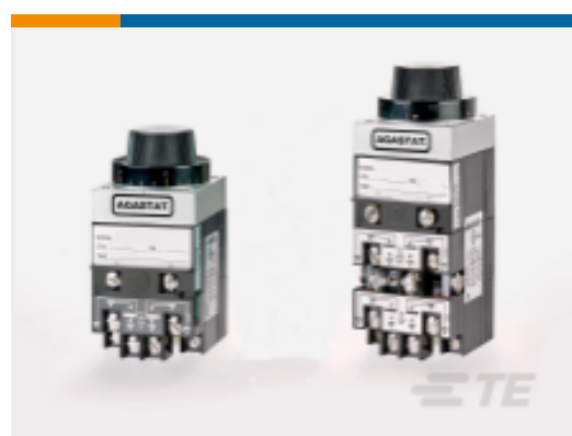
TE 产品编号 3-1423169-7 E7012SDI2004=RLY,NUC,ON,2P,250VDC,50S,12