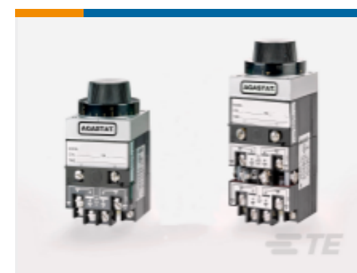
TE 产品编号 8-1437483-9 E7014PA004=RLY,NUC,ON,4P,125V