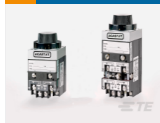
TE 产品编号 1423168-4 E7012ABLL004=RLY,NUC,ON,2P,120V,5S,LL