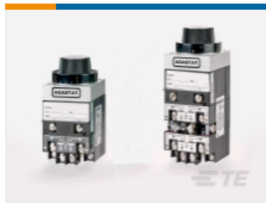
TE 产品编号 1423171-6 E7022PCB004=RLY,NUC,OFF,2P,12