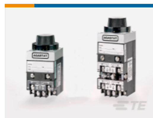
TE 产品编号 6-1437484-5 E7024PC004=RLY,NUC,OFF,4P,125