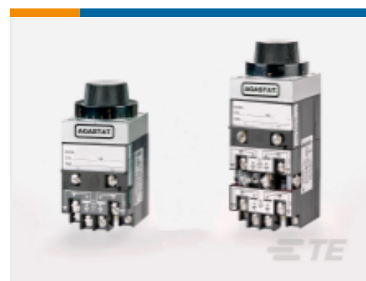
TE 产品编号 2-1437484-6 E7022CB004=RLY,NUC,OFF,2P,480