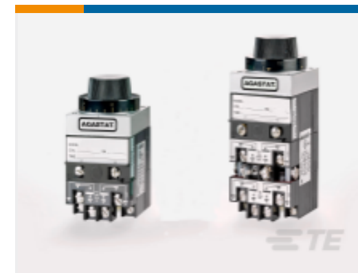
TE 产品编号 2-1437483-8 E7012AI004=RLY,NUC,ON,2P,120V