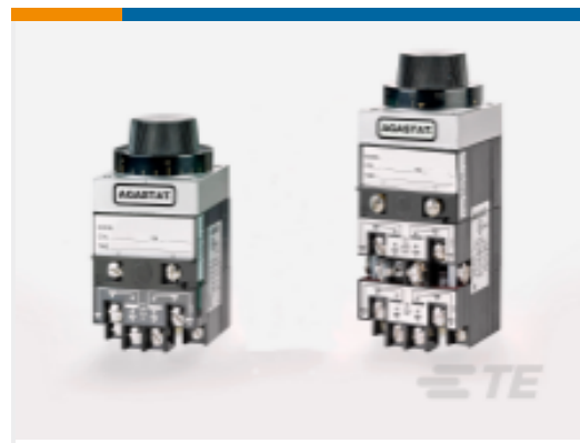
TE 产品编号 1-1423168-8 E7012ADL004=RLY,NUC,ON,2P,120V