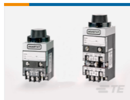
TE 产品编号 3-1423168-6 E7012ACLL004=RLY,NUC,ON,2P,120V,15S,LL