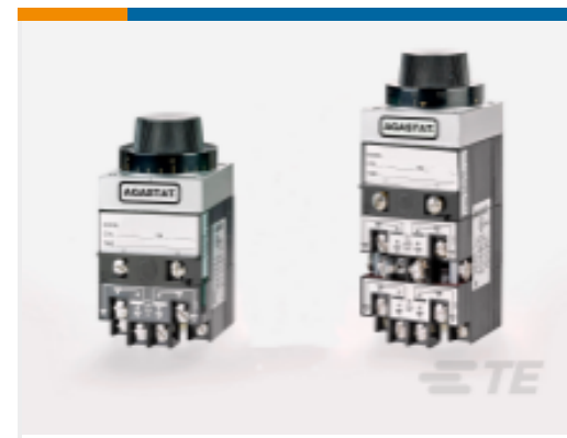
TE 产品编号 1-1437462-2 E7014AC004=RLY,NUC,ON,4P,120VA