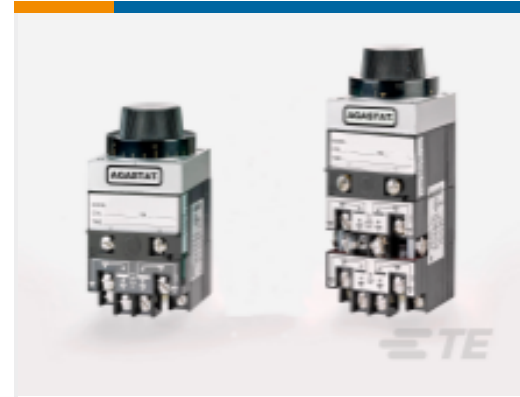
TE 产品编号 1-1437484-3 E7022AFT004=RLY,NUC,OFF,2P,12