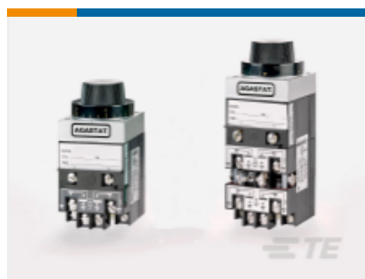
TE 产品编号 2-1437484-2 E7022BE004=RLY,NUC,OFF,2P,240