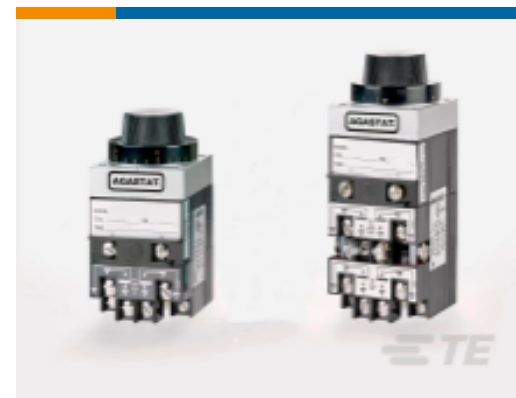
TE 产品编号 2-1437483-7 E7012AHL004=RLY,NUC,ON,2P,12