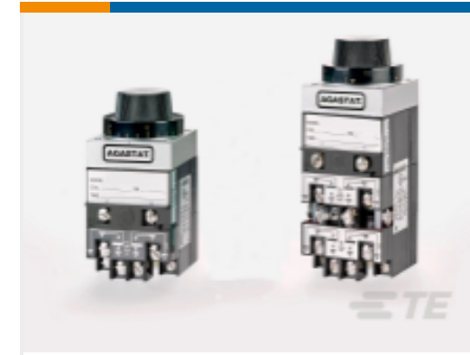
TE 产品编号 1423162-9 7022AE=RLY,STD,OFF,2P,120VAC,2