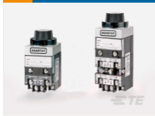
TE 产品编号 1-1423159-7 7012PA=RLY,STD,ON,2P,125VDC,1