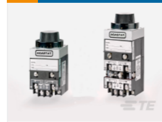
TE 产品编号 4-1437489-4 7022MKI=28VDC 1-300SEC