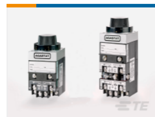
TE 产品编号 1-1423171-6 E7022PCT004=RLY,NUC,OFF,2P,12