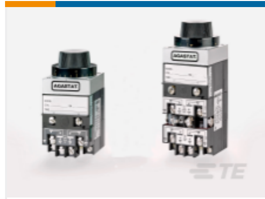
TE 产品编号 1423162-5 7022AC=RLY,STD,OFF,2P,120VAC,1