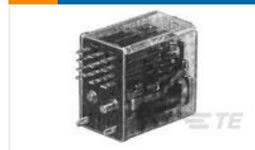
TE 产品编号3-1393766-5 R10-E1Y2-J5.0K=R10