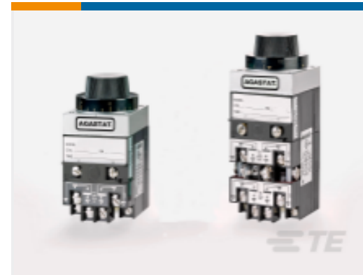
TE 产品编号 3-1437459-6 7024BB=RLY,STD,OFF,4P,240VAC,