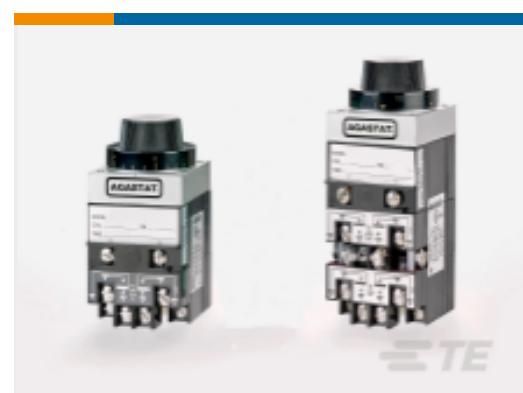
TE 产品编号 4-1423164-4 7022RHI1M=RLY,STD,OFF,2P,60VD