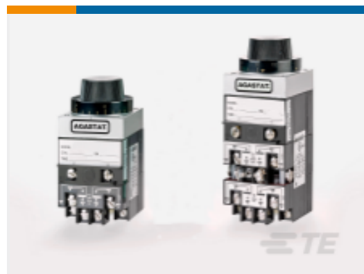
TE 产品编号 4-1423159-1 7012PKLLX=RLY,STD,ON,2P,125VDC