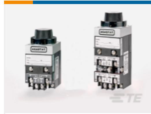
TE 产品编号 1423162-2 7022AB=RLY,STD,OFF,2P,120VAC,5