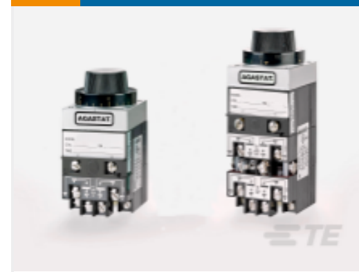
TE 产品编号 2-1423164-0 7022PC=RLY,STD,OFF,2P,125VDC,1