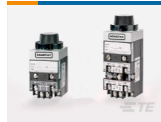
TE 产品编号 1423159-6 7012NF=RLY,STD,ON,2P,48VDC,10