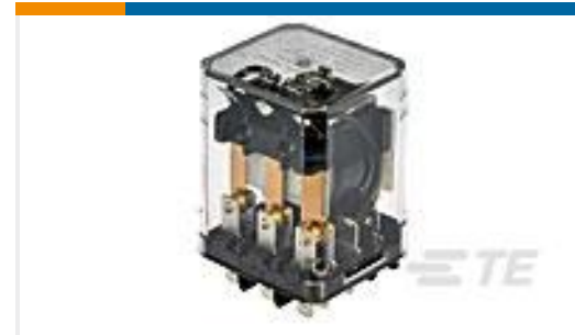
TE 产品编号1-1393117-9 KUP-11A15-120=KU