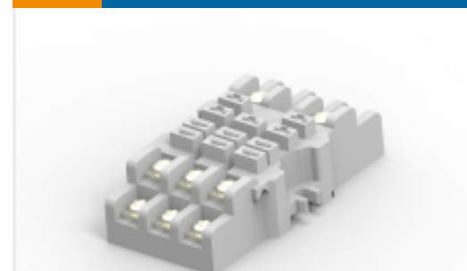
TE 产品编号1393143-5 27E121=SOCKET,KUP,11,SCW,PLE