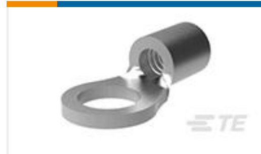
TE 产品编号35665 TERMINAL,SOLIS R 8 5/8