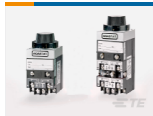
TE 产品编号 1423160-1 7014AB=RLY,STD,ON,4P,120VAC,7