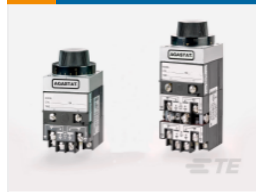
TE 产品编号 1-1423162-0 7022AF=RLY,STD,OFF,2P,120VAC,1