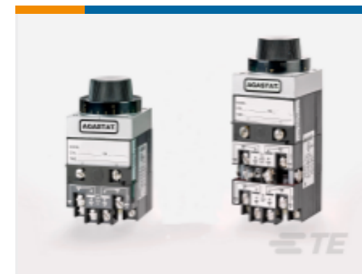
TE 产品编号 1423161-3 7014OC=RLY,STD,ON,4P,24VDC,20