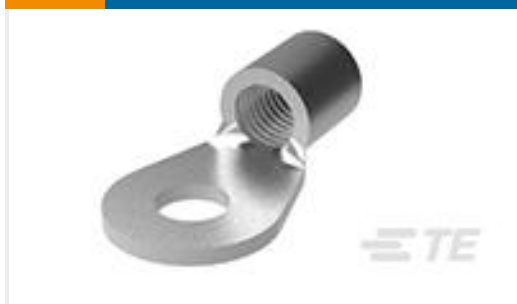
TE 产品编号33465 TERMINAL,SOLIS R 6 1/4