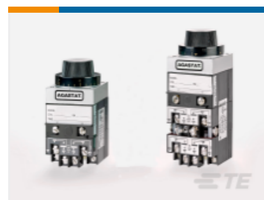
TE 产品编号 2-1437490-7 7022WCV=96V DC 1.5-15 SEC