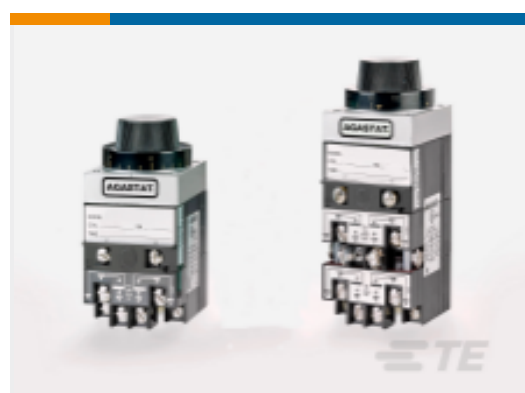
TE 产品编号 3-1423162-4 7022CK=RLY,STD,OFF,2P,480VAC,