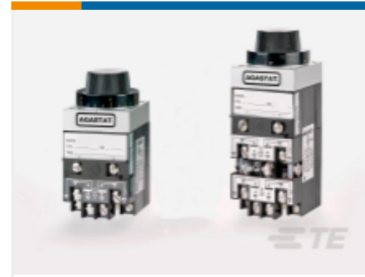
TE 产品编号 1-1423157-2 7012AE=RLY,STD,ON,2P,120VAC,20