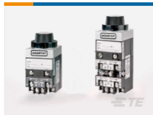
TE 产品编号 5-1423159-2 7012SD=RLY,STD,ON,2P,250VDC,50