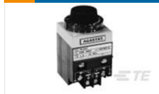
TE 产品编号3-1423159-9 7012PK=RLY,STD,ON,2P,125VDC 30