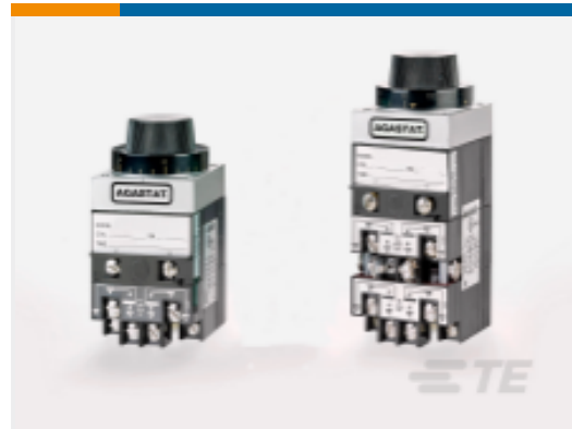
TE 产品编号 2-1423159-3 7012PC=RLY,STD,ON,2P,125VDC,15