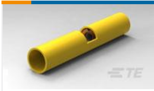
TE 产品编号320570 SPLICE BUTT PIDG 12-10