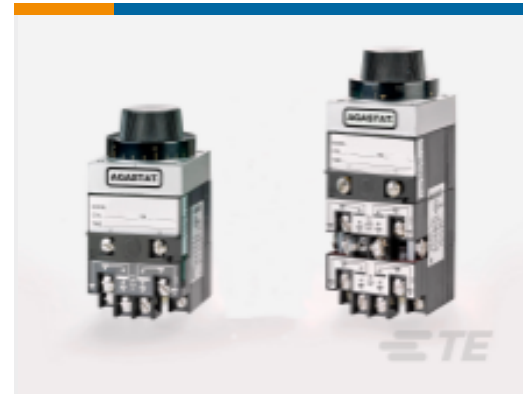
TE 产品编号 3-1423183-2 7032ABA=RLY,STD,DBH,2P,120V,7S,2S