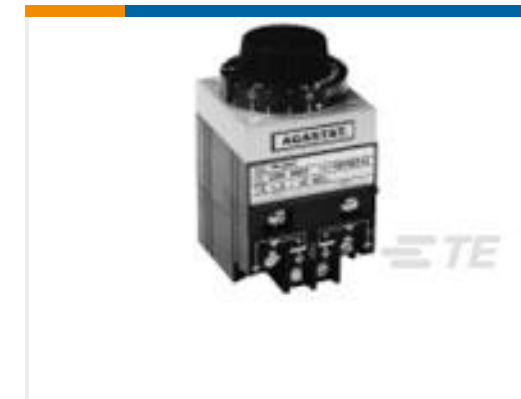
TE 产品编号 3-1423157-1 7012BD=RLY,STD,ON,2P,240VAC,50