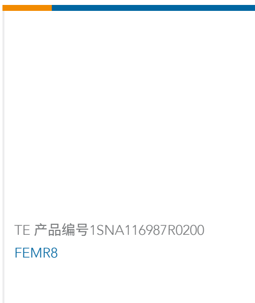
TE 产品编号 1SNA116987R0200 FEMR8