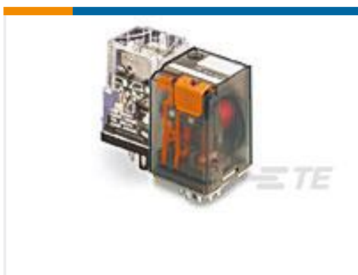
TE 产品编号 4-1393104-4 KRPA-11DG-125=KRPA