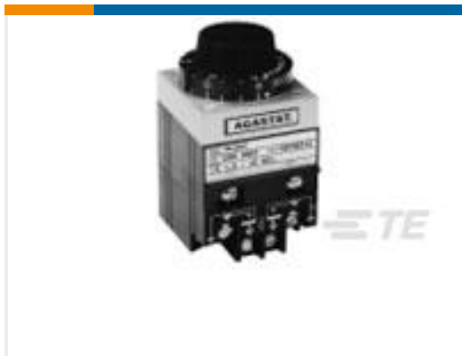
TE 产品编号 1-1423159-7 7012PA=RLY,STD,ON,2P,125VDC,1