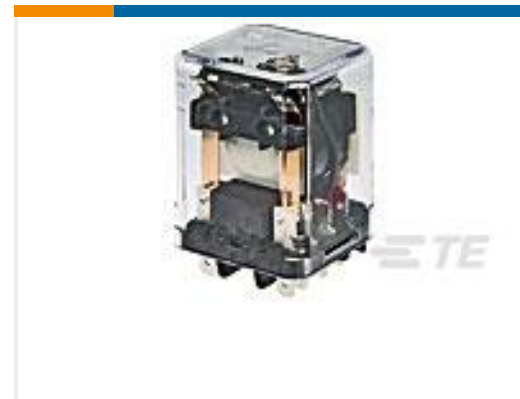
TE 产品编号 8-1393113-3 KUEP-11A15-120=RELAY,GENPUR,QC