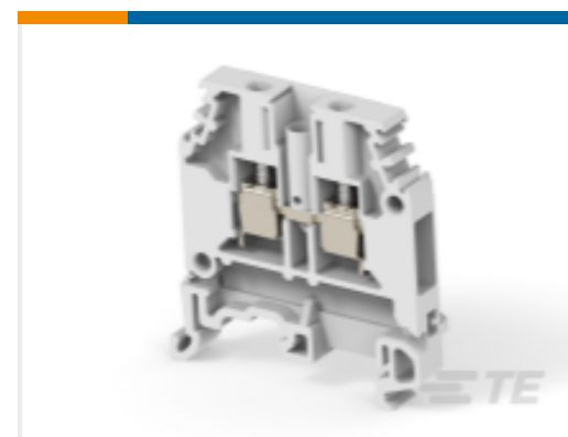
TE 产品编号 1SNA115192R0400 M4/6.4