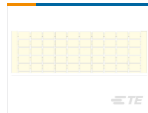
TE 产品编号 1SNA233041R2500 RC610 1->10 (X10) VERTICAL