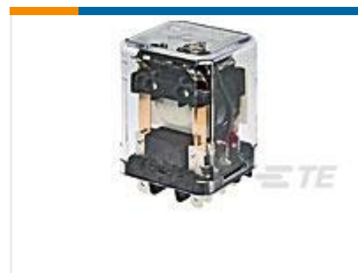
TE 产品编号 4-2027183-3 KUEP-11D15-125=RELAY,3A,2C, AGCDO,QC.187,