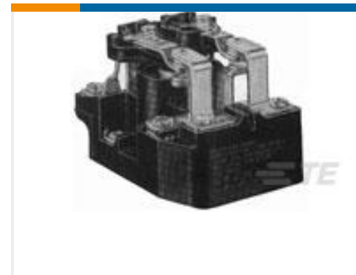
TE 产品编号 1393127-9 PRD-11AG0-120=PRD