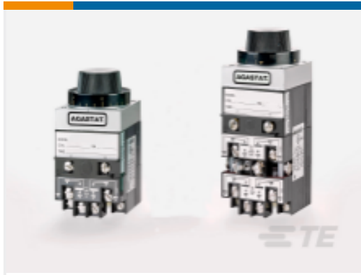
TE 产品编号 3-1423159-3 7012PJ=RLY,STD,ON,2P,125VDC,1