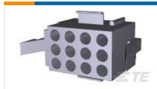
TE 产品编号 1-480275-0 12P CMNL PLUG HSG P/M NATL