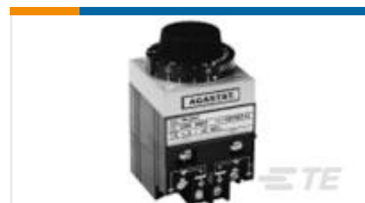
TE 产品编号 2-1423162-9 7022BK=RLY,STD,OFF,M2P,240VAC,