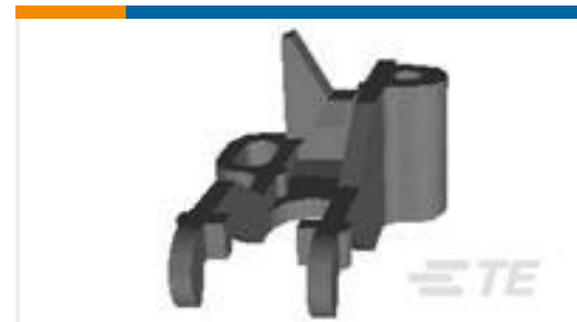
TE 产品编号 1-350589-0 STR/REL CLAMP NATL