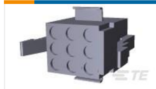
TE 产品编号 1-480274-0 09P CMNL PLUG HSG P/M NATL