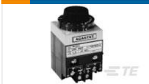
TE 产品编号 1423162-9 7022AE=RLY,STD,OFF,2P,120VAC,2