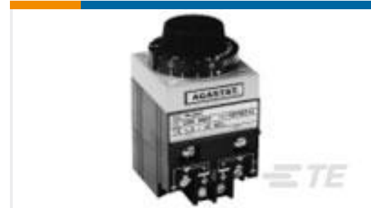
TE 产品编号 3-1423159-3 7012PJ=RLY,STD,ON,2P,125VDC,1