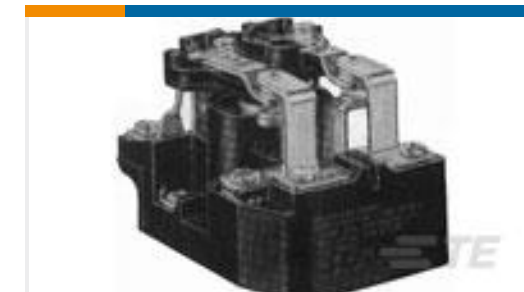
TE 产品编号 4-1393127-6 PRD-11DH0-110=PRD