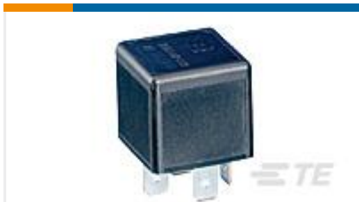
TE 产品编号 5-1393302-1 V23134A0053C643-EV-CBOX