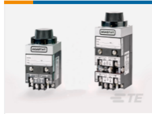
TE 产品编号 1-1423162-8 7022AK=RLY,STD,OFF,2P,120VAC,1