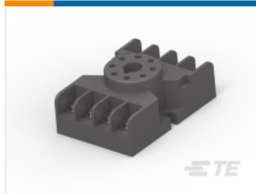
TE 产品编号1393143-6 27E122=SOCKET,KRP,8,SCW,PLES