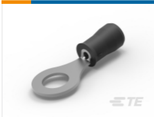
TE 产品编号35112 PIDG Ring Tongue Terminals