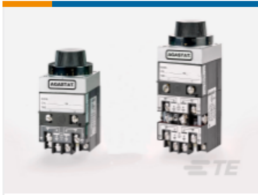
TE 产品编号 1-1423162-8 7022AK=RLY,STD,OFF,2P,120VAC,1