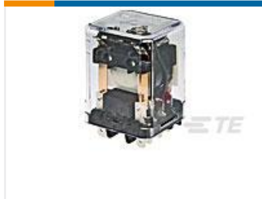
TE 产品编号8-1393113-7 KUEP-11D15-24=KU-