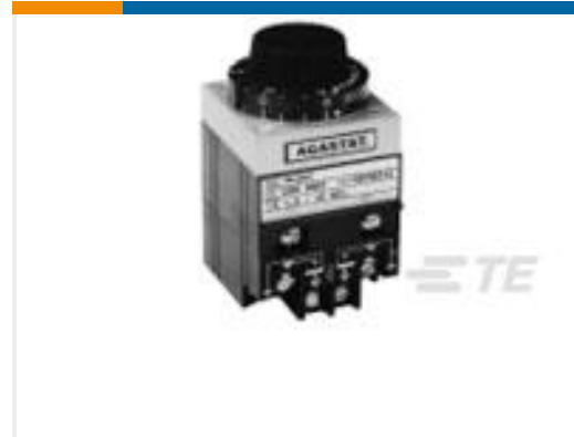
TE 产品编号1423157-2 7012AB=RLY,STD,ON,2P,120VAC,5S