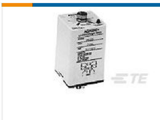
TE 产品编号3-1437466-5 VMAXBA=*