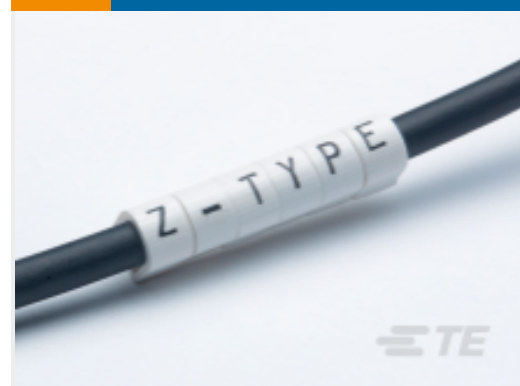
TE 产品编号EJ1953-000 06151413