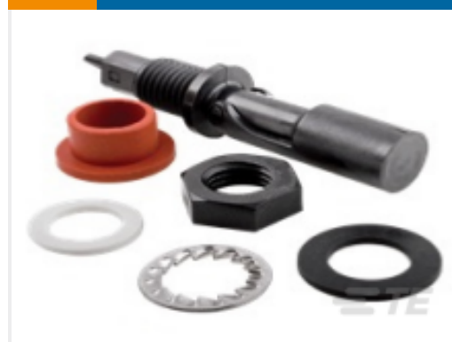
TE 产品编号80645-000 LS809-51 Liquid Level Sensor