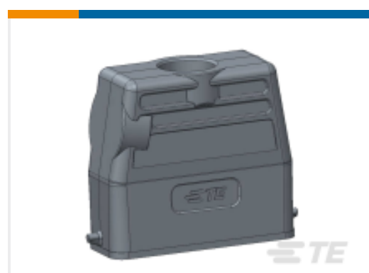
TE 产品编号T1349160120-000 H16A-TGH-M20