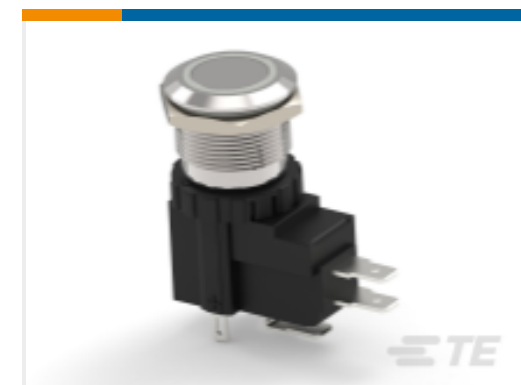
TE 产品编号2-2364570-8 AVH19 FLT SS LK RNG R&B 24V16A