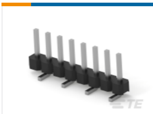
TE 产品编号2842104-8 8P,2MM,BRK HDR,SRVT,SMD,0.76AU, TR W/CAP