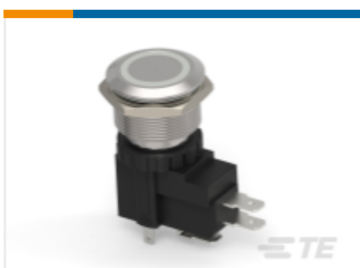
TE 产品编号1-2364686-5 AVH22 FLT SS MT RNG GRN 24V16A