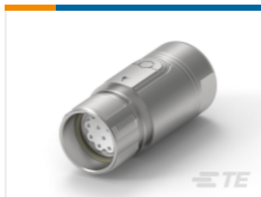
TE 产品编号AKA012N00410100000 623 EXTENSION, SPEEDTEC