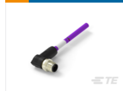
TE 产品编号TAB62246501-040 M12B2-MR-PUR TORSION-4.0M