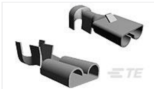
TE 产品编号150572-2 MINI FASTON 110 REC 20-16 AWG TPBR