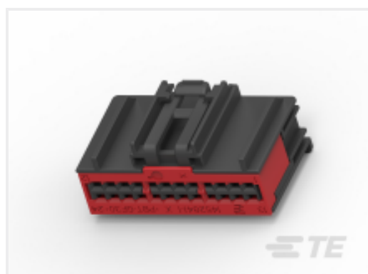
TE 产品编号1452839-5 24 POS FEMALE HSG ASSY