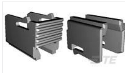
TE 产品编号965383-1 MOS SICHERGSCHIEBER 8POS