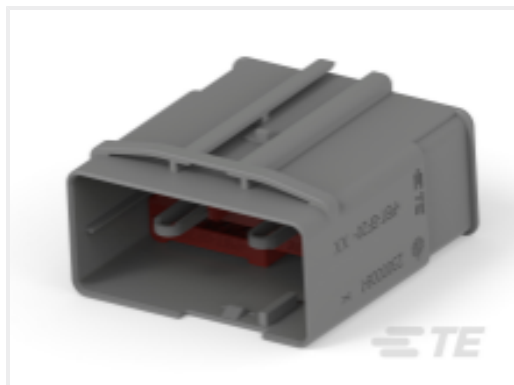
TE 产品编号2300007-1 24POS,0.64 MALE GEN. Y,PIN HSG, ASSY