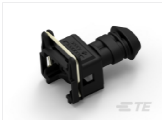
TE 产品编号1703727-1 2POS,JPT,HOUSING,ASSY,BK