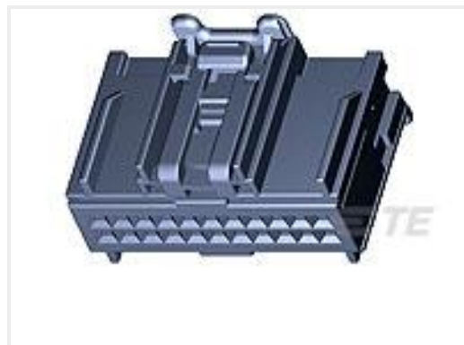
TE 产品编号3-1419158-0 INLIN CONN.FEMAL22P