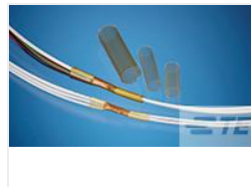
TE 产品编号6776556004 RPPM-NR510-X-50MM