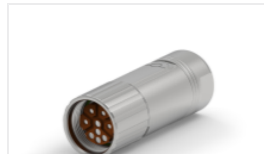
TE 产品编号BSA082N00420235000 923 PLUG