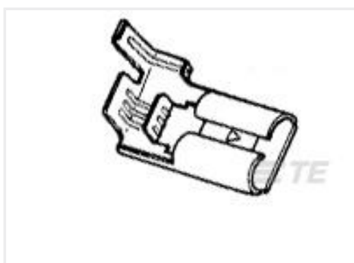
TE 产品编号1-1627087-0 RECEPTACLE, FLAG QC 4.8x0.8 (H25411)