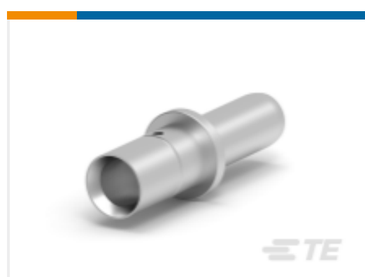
TE 产品编号SRK-PC-080-25-601 PIN, SOLID, SIZE M8, 25mm2, AG