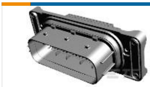
TE 产品编号1-1418362-3 62 POS MIXED HEADER CODA