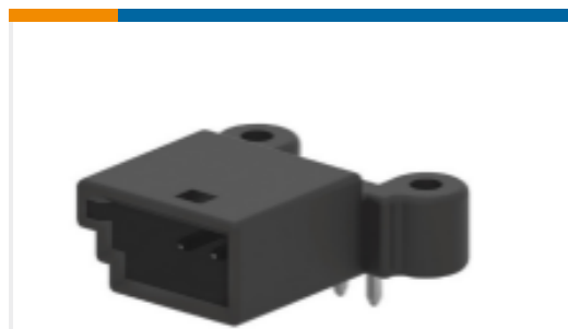
TE 产品编号953118-4 Signal Header