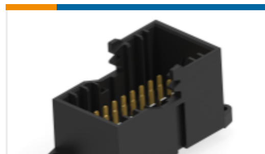
TE 产品编号1-1670615-2 36POS,MIXED,HEADER ASSY,CONV. KIT 25POS