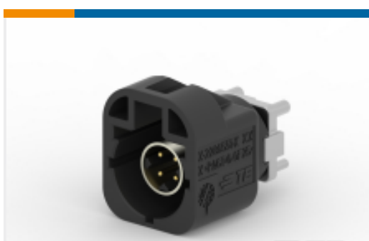
TE 产品编号2286547-1 HSD,HDR ASSY,180DEG,COD A